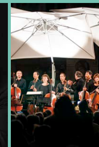
Ensemble CELLO FAN